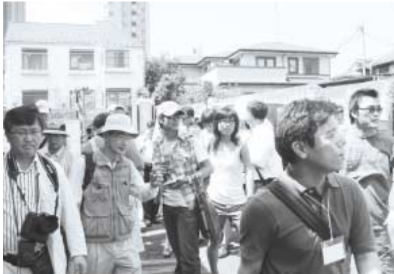
第1回国際ワークショップで参加者とともにまちを歩く