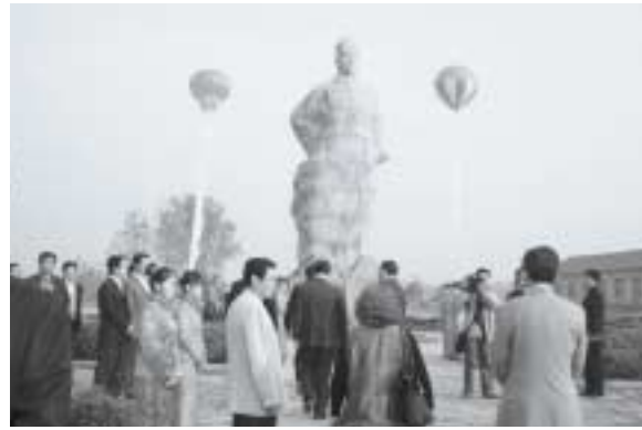
中国・江蘇省蘇州府に建つ徐福像

場所づくりも始まった。台湾でのケースのように、華僑あるいは渡来人の先達として徐福を捉えていこうという動きもある。