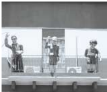
アルゼンチンが誇る3人の英雄。左からガルデルム、エピータ、そしてマラドーナ。(カミニート地区にて)

2005年度にトヨタ財団ではFANA (Federación de Asociaciones Nikkei en la Argentina / 社団法人在亜日系団体連合会) による、「アルゼンチン日本人移民史第二巻戦後編」の刊行プロジェクトの一部を助成させていただきました。今後第一級の史料となるであろう浩瀚な移民史がようやく出版の運びとなった後、アルゼンチン日本人移民資料館の