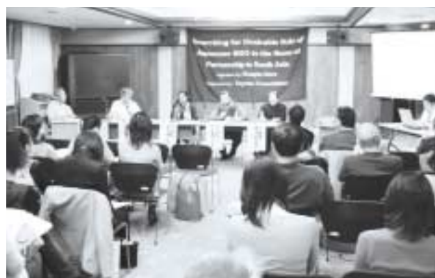
トヨタ財団助成プロジェクトとして名古屋市で行われた国際NGOシンポジウム

われわれはバングラデシュのローカルNGOとして一人前になりたいという気持ちで、ずっと活動をしてきた。気がつくと、ほかのローカルNGOはもっと大きくなって立派な活動をしている。日本から来ている国際NGOとして南アジアでどういう活動をしていけばよいのかということを考えつつ、日々の努力をしているところである。