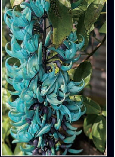
本州では温室でしか育たないと言われているヒスイカズラが軒先に咲いていました！[Y.N.]