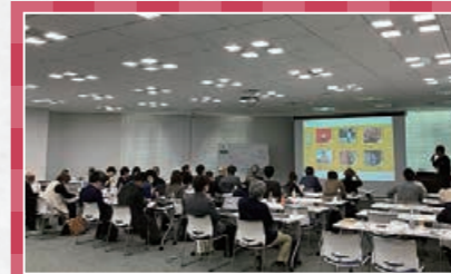
国内助成プログラム 成果報告会 & 中間研修・ 報告会を開催

2 026年2月13日と14日、ビジョンセンター東京京橋にて、国内助成プログラム成果報告会 & 中間研修・報告会を開催しました。