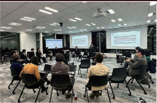
本研究で実施した対話型イベントの様子