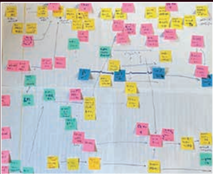
リビングラボが地域からどのような影響を受け、どのように(紆余曲折しながら)進んだか?の分析

る。これまでに、日本各地でリビングラボ的な実践を長期的に行っている人たちへのインタビューを行い、日本の社会文化的文脈の中で効果的かつ継続的にリビングラボを実践するためのヒントを探索、抽出してきた。また、その成果を活用し、リビングラボの立ち上げやマネジメント(管理)のために活用可能な各種ツールも開発してきた。