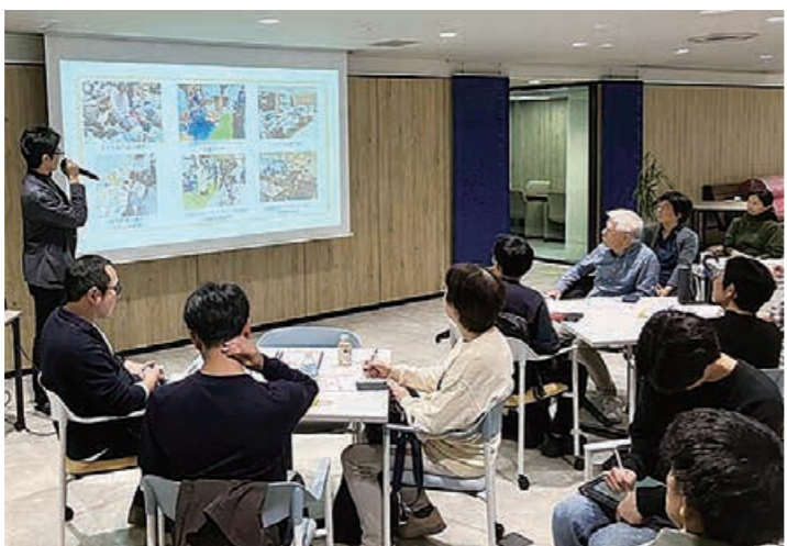
右：地域貢献メッセ 左：つながる交流会

助成事業としては一区切りとなりましたが、引き続き、多くの「団員」とともに、地域で子どもが誰も取り残されず、安心して育つことができるための活動を続けていきたいと考えています。