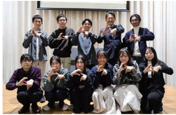
高校生チームの成果報告会および蒲郡プログラミングコンテスト表彰式の記念写真。いずれもポーズは蒲郡の「G」です。