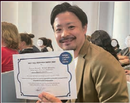
リビングラボの国際会議でベストペーパー賞を受賞