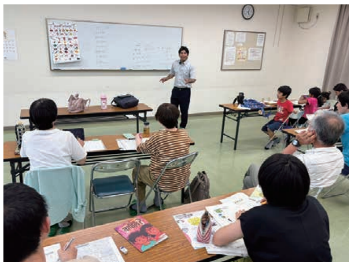
右ページ上：兵庫県立芦屋国際中等教育学校の校長室にある生徒の出身国の国旗 上：名古屋ネパール語教室

兵庫県立芦屋国際中等教育学校には、全生徒が多様な言語や文化を学ぶ「芦屋インターナショナル・タイム」という科目があります。2023年度は、中国語、韓国・朝鮮語、スペイン語、ポルトガル語、ロシア語、タガログ語、ネパール語の7言語から、生徒は一つ選んで学習していました。ネパール語の場合、