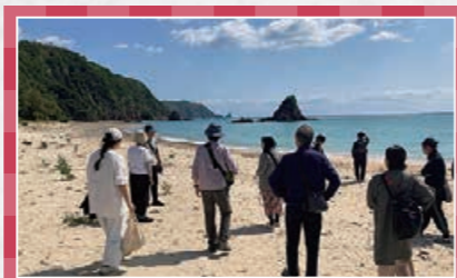
国内助成プログラム同窓会企画 「今そこにある協同を確かめる。沖縄の自然文化満喫1泊2日ツアー」

り」のカテゴリーで助成を受けられた方々に朝早くからお集まりいただき、午前中は中間研修の場として、4チームに分かれて「仮想理事会」を行いました。この研修では、各チームの発表団体に対して参加者が仮想の理事になり、アドバイスや質問を重ねることで、他のプロジェクトの理解を深めたり、自分が実施しているプロジェクトへのフィードバックにもなるようなワークを体験していただきました。各テーブルで温かな視点でのアドバイスや課題の共有がなされ、活発な意見交換の場になりました。 午後からは23年度助成の8プロジェクトと1年間の期間延長を行った22年度助成の1プロジェクト、計9プロジェクトから成果報告をしていただきました。前日に引き続き当時選考委員として携わってくださった方々からのコメントや質疑応答も行い、発表団体のプロジェクトをより深く知る時間となりました。