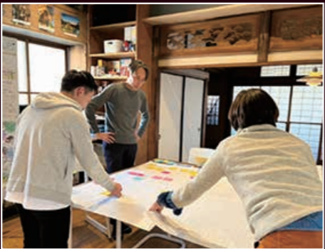
おやまちリビングラボの事例分析をしている様子