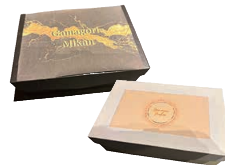
高校生がデザインした、みかんの段ボールパッケージ

【助成題目】 デジタル技術を活用した若者主体の地域課題解決型プラットフォーム「蒲郡ハッカソン」